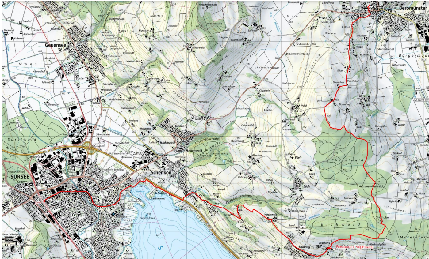
Vormittag: Beromünster – Blosenberg – Restaurant Vogelsang