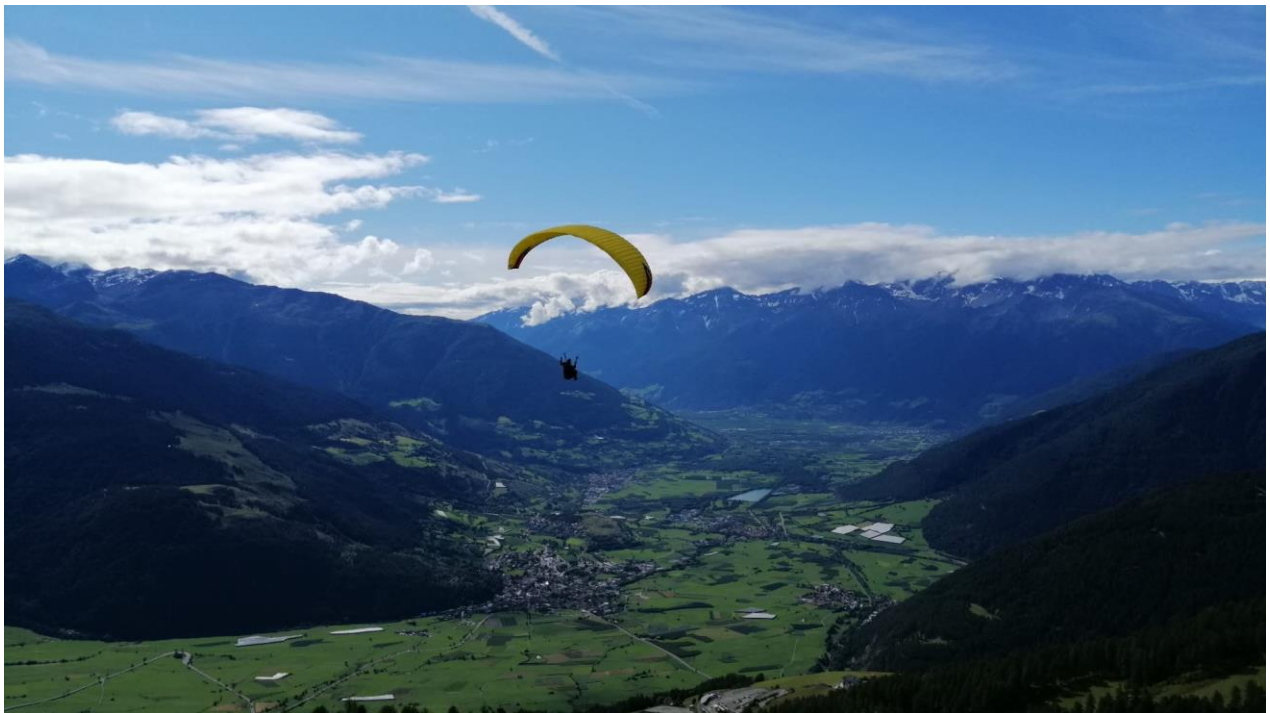
Start vom Watles im Vinschgau