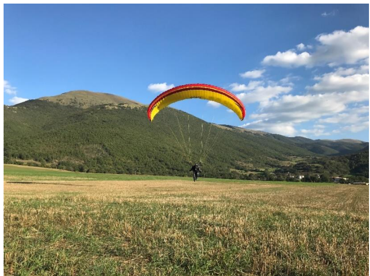
Landung im Nowhere in Castelluccio/Italien

Was fasziniert mich denn am Fliegen? Immer noch durchströmt mich ein Glücksgefühl, wenn ich jeweils nach einem gelungenen Start abhebe. Die Zusammenarbeit mit der Natur, ohne künstlichen Antrieb, die Thermik nutzend, einer Felswand entlang langsam höher steigend, bis man auch den höchsten Gipfel überhöht hat und sich ein wunderbares Panorama eröffnet. Aber schon zuvor, das Auslegen des Gleitschirms, das Spiel mit dem Wind, das Ordnen der Leinen, das Prüfen der Windstärke und Richtung, bietet seinen eigenen Reiz. Oder zusammen mit Bergdohlen die Thermik nutzend, im gleichen Schlauch höher steigen. Nicht zuletzt, so glaube ich zumindest, stellen wir für all die anderen Menschen, die sich ebenfalls vor Ort aufhalten, keine Belastung, sondern eine Attraktion dar.