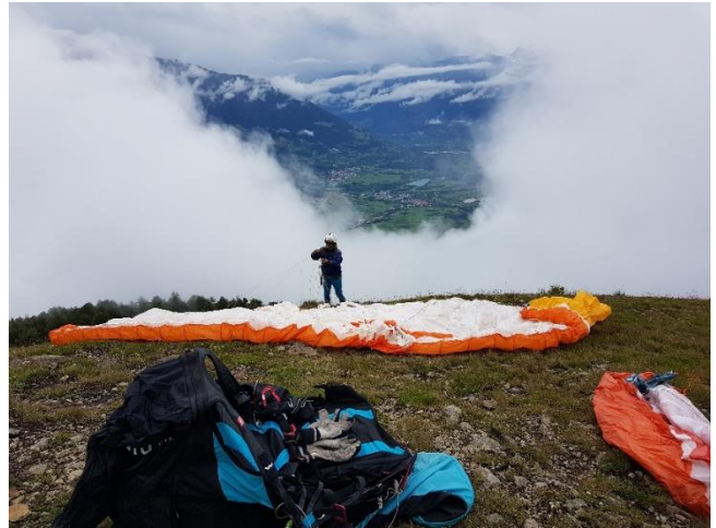
Muss ich wieder zusammenpacken oder wird es besser?

Aber es gibt noch viel mehr das mich fasziniert, zum Beispiel die Kontakte mit all den anderen Kolleginnen und Kollegen die den gleichen Sport betreiben. Welche Sportart sonst kann man dermassen generationenübergreifend mit einer solchen Leidenschaft betreiben? Gemeinsam mit anderen eine Woche Flugferien verbringen, Erfahrungen austauschen, Neues lernen, die Geschichte erfahren die sich hinter jeder einzelnen Person verbirgt. Egal ob alt oder jung, man ist gleichermaßen geschätzt und akzeptiert. Und wenn mir der 27-jährige Leiter anerkennend nach einem gelungenen Manöver auf die Schulter klopf, dann ist das, wie soll ich sagen, Balsam auf die Seele eines Pensionärs.